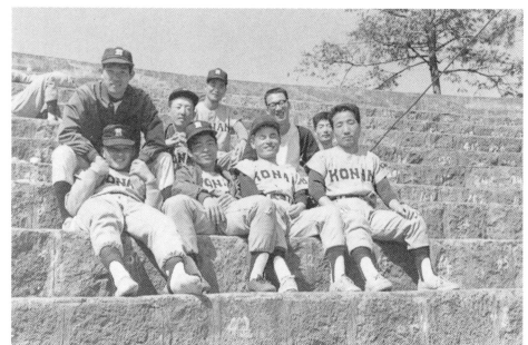
昭和39年春 徳山合宿